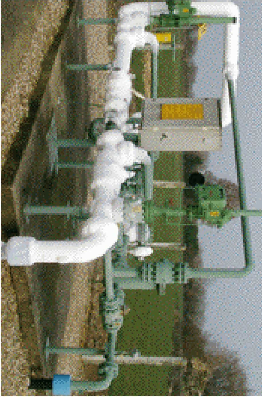
Poste livraison gaz