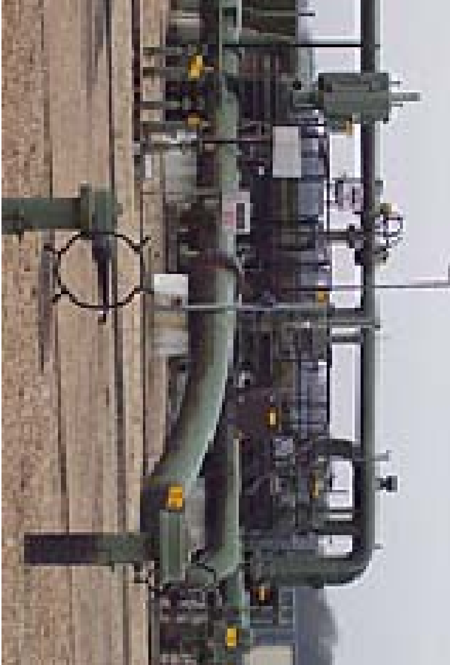
Poste livraison gaz